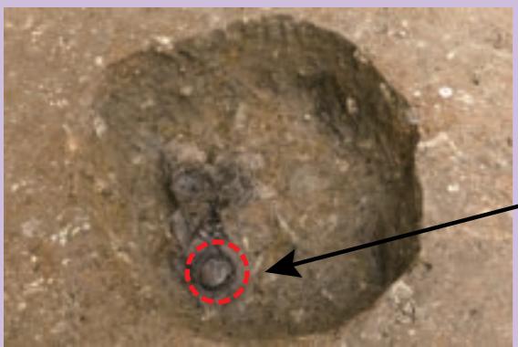
鏡埋納土坑 SX094 和鏡出土状況