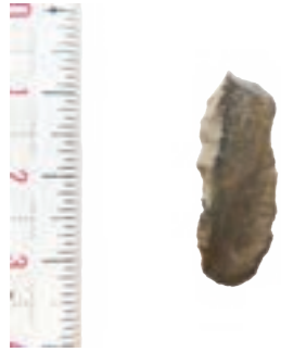
出土したナイフ形石器

ナイフ形石器は、狩りに使うヤリのヤリ先として使用されたと石器です。奈良県と大阪府の境にある二上山で産出するサヌカイトで作られています。尼崎市で旧石器時代の石器が見つかるのはこれが初めてです。