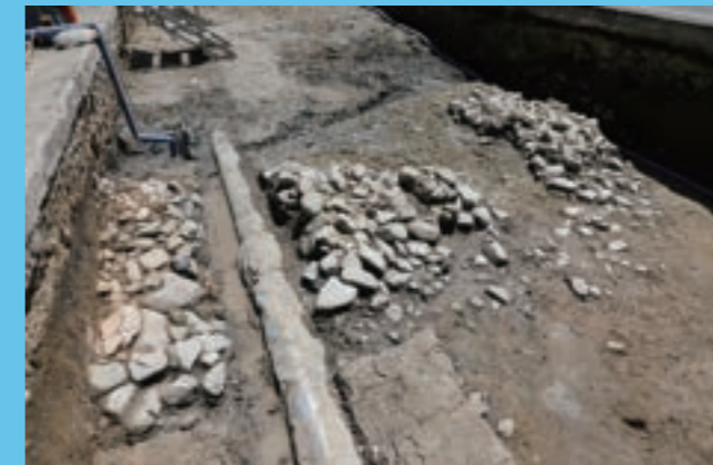
周溝に沿って転落した葺石