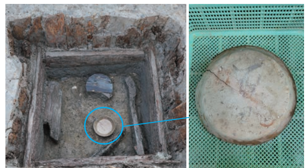
3区 井戸枠内遺物出土状況と墨書土器