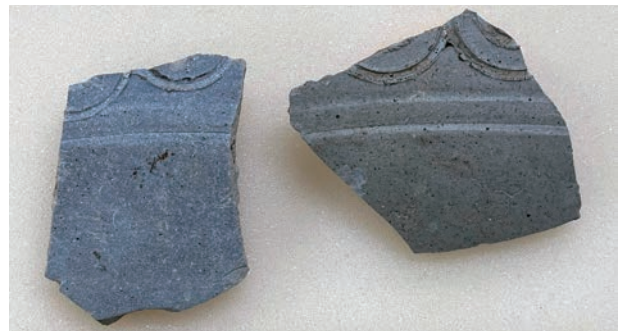
コンパス文の描かれた初期須恵器の器台の破片

カマドには2つの鍋が横並びにかけられ、鍋の底部を支える長細い石（支脚）が立てられていました。カマドの袖は黄色い粘土を使って築かれ、袖の骨組みに杭を何本も打設していたことも解明されました。