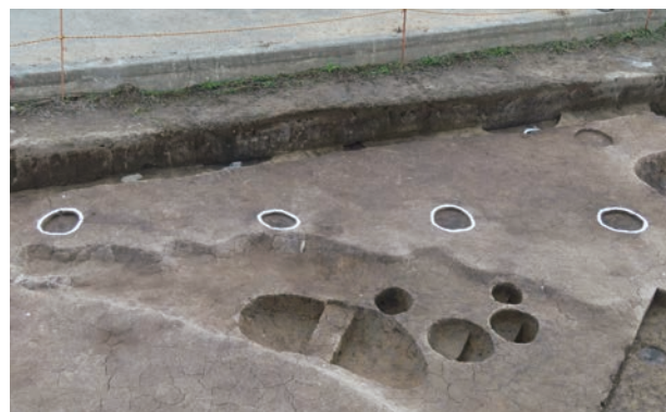
古代の掘立柱建物 (西から)