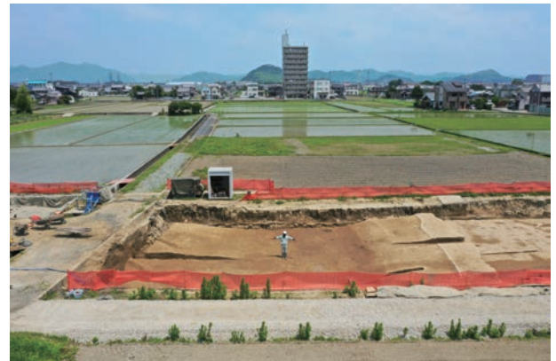
4区西側の谷状地形