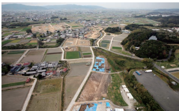
荒目遺跡遠景 (東から)