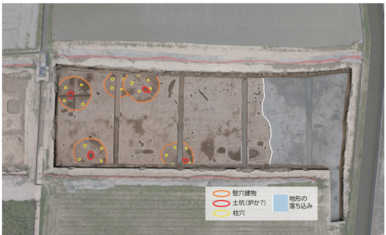
5区竪穴建物の分布状況（上空からの俯瞰写真）