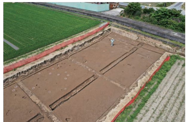
平地建物を構成する柱穴群