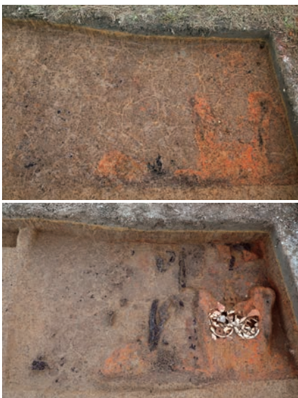
焼失住居の埋土上面と床面の検出状況