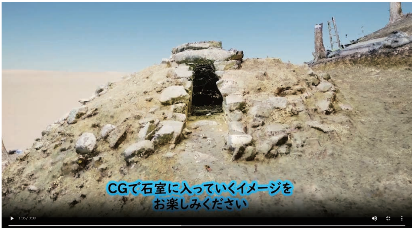
古墳のCG動画（この後カメラは石室の内部へと移動）