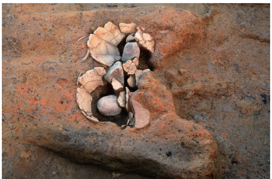
石製支脚と鍋の残された二つ掛けカマド