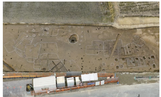
3区中央部遺構全景