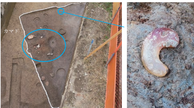
1区 カマドをもつ竪穴建物と勾玉