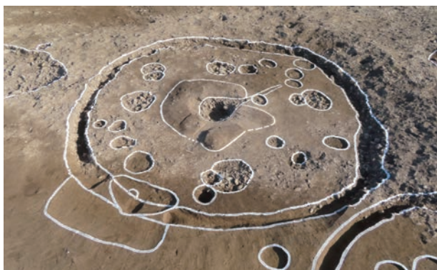
入口の張り出しをもつ竪穴建物 (西から)