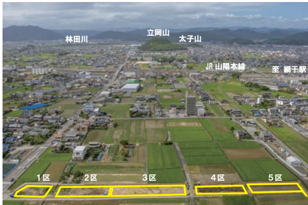
調査地とその周辺（南から）

出土した土器から、建てられた時期は平地建物の多くが縄文時代後期（約4,000～3,000年前）の前葉、一部の平地建物と竪穴建物がその中葉と、大きく2時期に分かれます。後期中葉以降の縄文時代の建物は確認されていません。