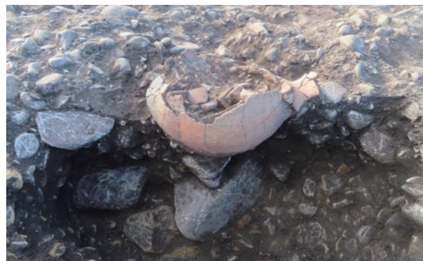
土坑から出土したほぼ完形の弥生土器 (北から)