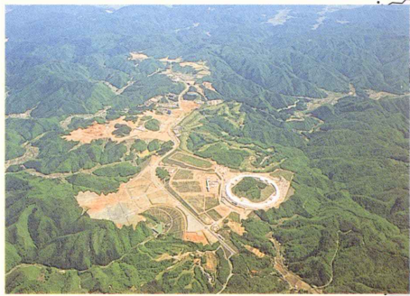
播磨科学公園都市（テクノポリス）