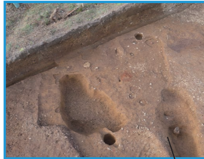
古墳時代の竪穴建物跡