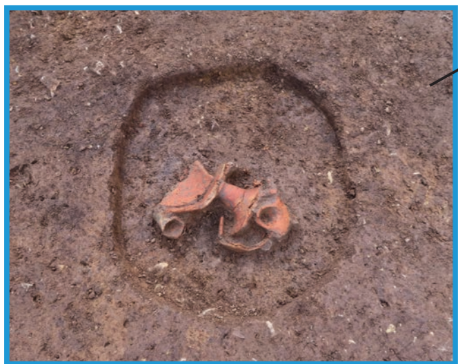
古墳時代の土師器（高坏）が見つかった土坑