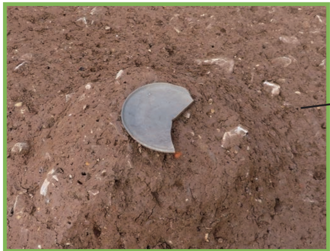
奈良時代の土坑から見つかった須恵器蓋転用の硯