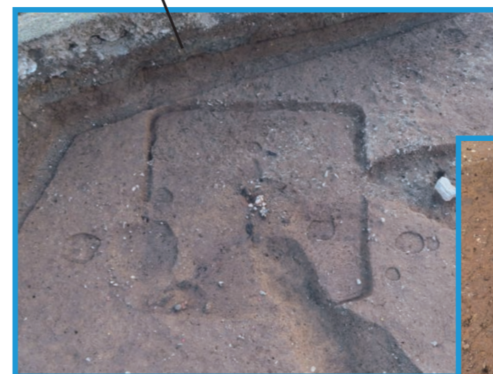
古墳時代の焼失住居（右写真は炭化した屋根材）