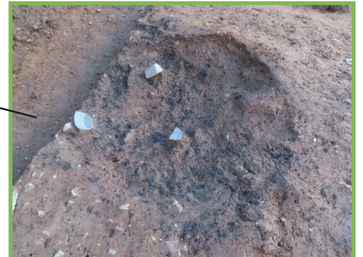
焼土と炭化物が多量に見つかった奈良時代の焼土坑