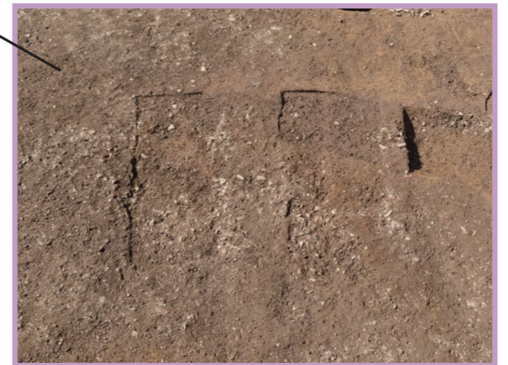
2基並んで見つかった鎌倉時代の木棺墓