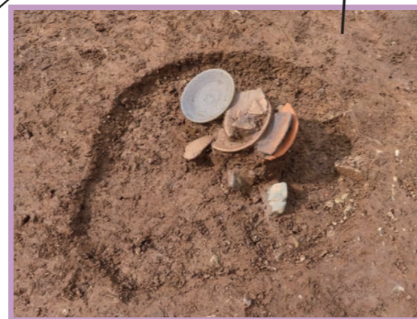
須恵器と土師器が重なって見つかった鎌倉時代の土器埋納土坑