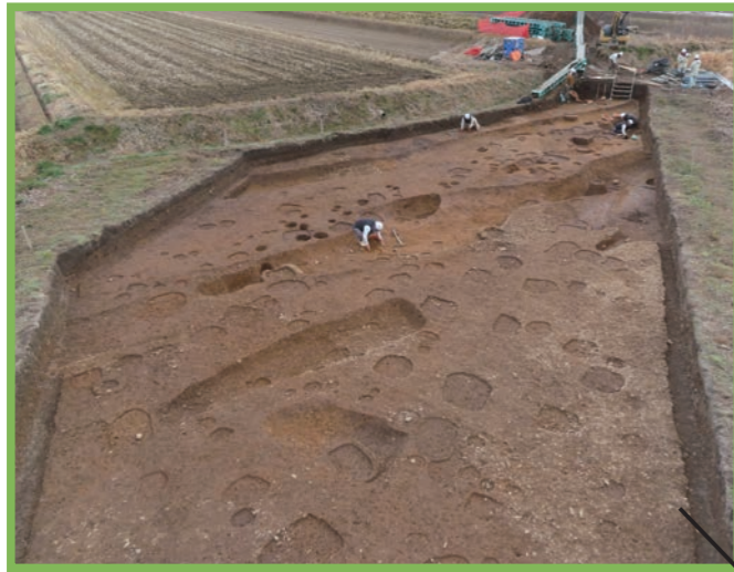
奈良時代の柱穴群と溝・旧河道