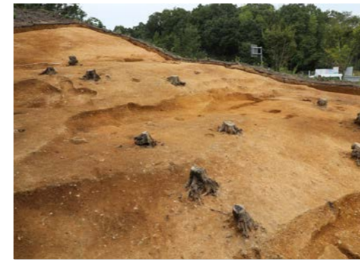
平坦面の様子（南西から）

調査の結果、古墳時代後期後半から飛鳥時代前半頃（約 1,400 年前）の集落跡がみつかりました。斜面を大規模に切り盛りして平坦面を造り、そこに たてあな 竪穴建物や ほったてぼしら 掘立柱建物がつくられていたことがわかりました。建物を建て替えた様子もうかがえ、当時の人々はこの場所である程度継続して生活を営んでいたようです。遺跡からは、 すえき 須恵器・ はじき 土師器と呼ばれる土器や鉄器などが出土しました。いずれも当時の生活に欠かせない道具で、須恵器は食器や貯蔵具として、土師器は主に調理の際に使われ、鉄器はモノの加工に用いられました。また、竪穴建物の床面をはじめとして、いくつかの場所で火を受けた痕跡がみられました。調理時に火を焚くカマドに伴うものもありますが、 てつかじ 鉄鍛冶などのモノづくりに伴う可能性があるものも存在します。約 1,400 年前の人々の生活を知りうる貴重な成果となりました。