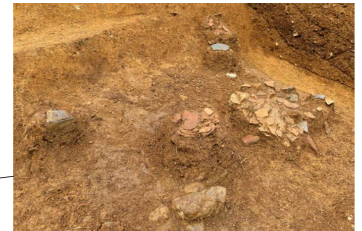
土器の出土状況（南西から）

灰色の土器が須恵器、赤もしくは茶色の土器が土師器です。須恵器は高い温度で焼かれるため、表面が硬くて水に強く、土師器は火にかけることができます。古墳時代の人々は使い道に応じて両者を使い分けていました。