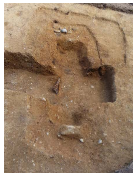
第 4 主体部（西から）