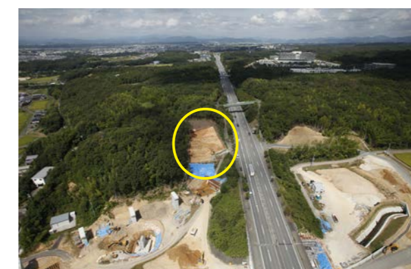
池尻東山遺跡 遠景（南上空から）