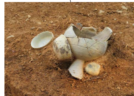
須恵器の出土状況（北西から）