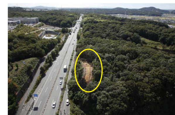
市場南山 1 号墳 遠景（北上空から）