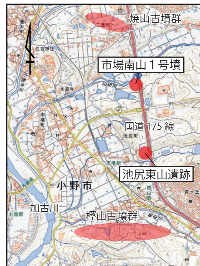
調査地点の位置（国土地理院地図に加筆）

池尻東山遺跡は加古川東岸、小野台地の西端に発達する丘陵の南側斜面に立地します。市場南山 1 号墳は池尻東山遺跡の北方約 1 km、同様の丘陵の主尾根から少し下った南側斜面に立地しており、かつて国道 175 号線建設時に古墳の周溝の一部が調査されました。周辺には焼山古墳群や檜山古墳群をはじめ、数多くの古墳が存在する地域です。