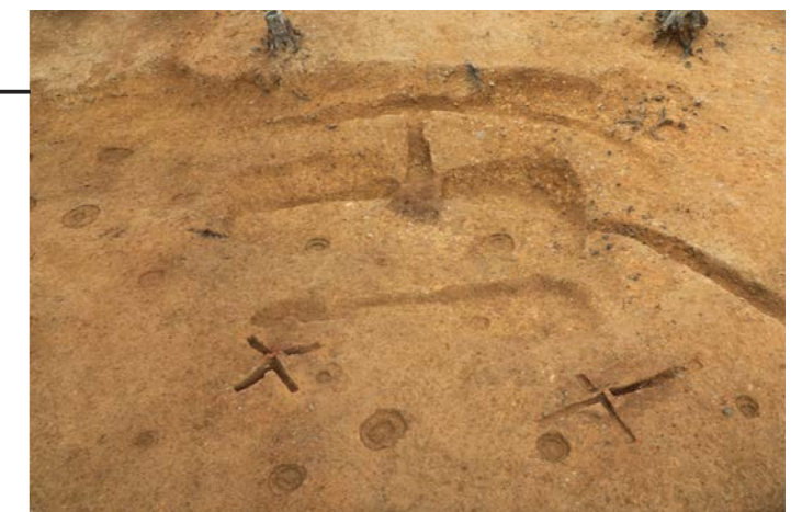
竪穴建物 SH106・121（南から）