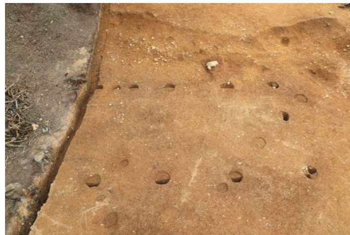
掘立柱建物 2（南から）