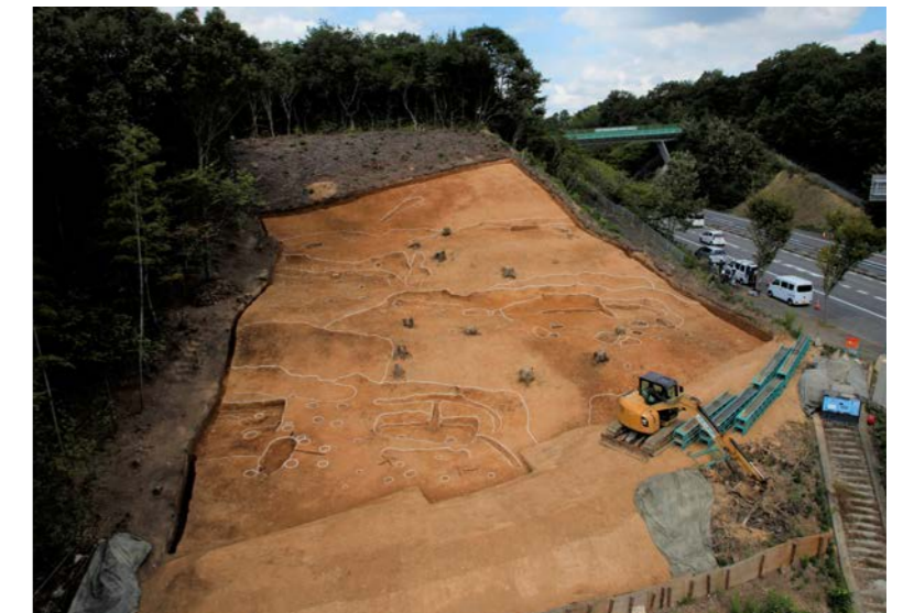
遺跡の全景（南上空から）