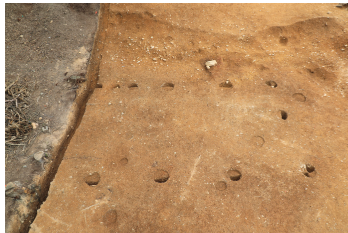
掘立柱建物 2（南から）