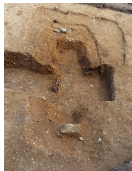
第 4 主体部（西から）