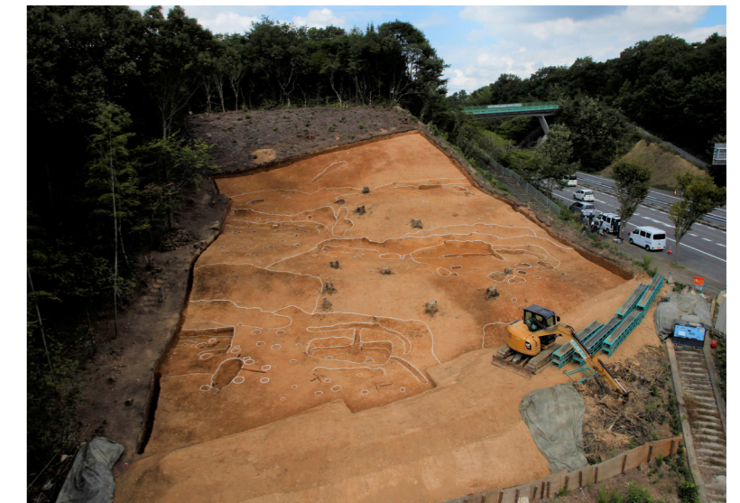
遺跡の全景（南上空から）