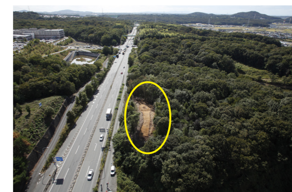
市場南山 1 号墳 遠景（北上空から）