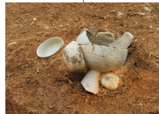
須恵器の出土状況（北西から）