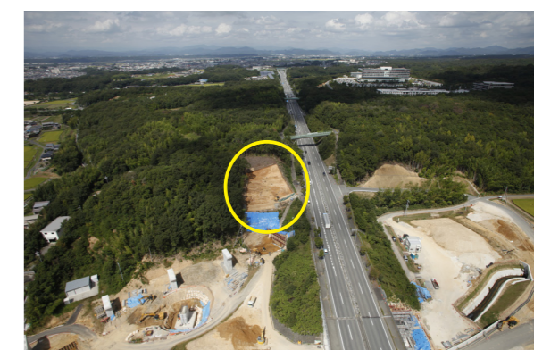
池尻東山遺跡 遠景（南上空から）