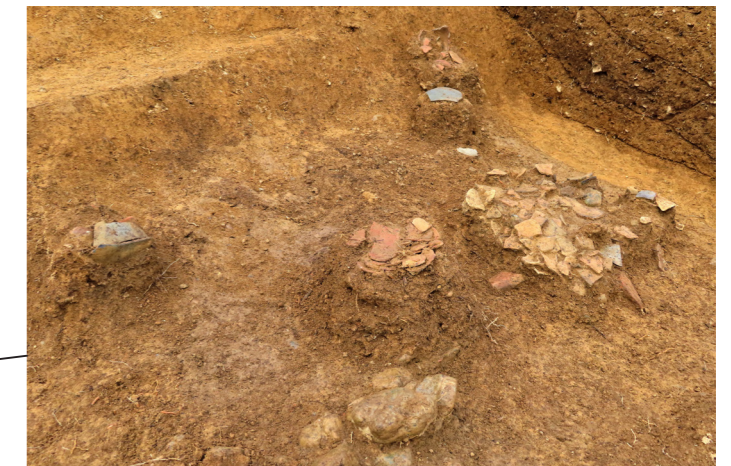
土器の出土状況（南西から）

灰色の土器が須恵器、赤もしくは茶色の土器が土師器です。須恵器は高い温度で焼かれるため、表面が硬くて水に強く、土師器は火にかけることができます。古墳時代の人々は使い道に応じて両者を使い分けていました。