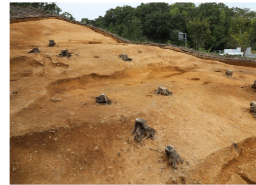
平坦面の様子（南西から）

調査の結果、古墳時代後期後半から飛鳥時代前半頃（約 1,400 年前）の集落跡がみつかりました。斜面を大規模に切り盛りして平坦面を造り、そこに たてあな 竪穴建物や ほったてぼしら 掘立柱建物がつくられていたことがわかりました。建物を建て替えた様子もうかがえ、当時の人々はこの場所である程度継続して生活を営んでいたようです。遺跡からは、 すえき 須恵器・ はじき 土師器と呼ばれる土器や鉄器などが出土しました。いずれも当時の生活に欠かせない道具で、須恵器は食器や貯蔵具として、土師器は主に調理の際に使われ、鉄器はモノの加工に用いられました。また、竪穴建物の床面をはじめとして、いくつかの場所で火を受けた痕跡がみられました。調理時に火を焚くカマドに伴うものもありますが、 てつかじ 鉄鍛冶などのモノづくりに伴う可能性があるものも存在します。約 1,400 年前の人々の生活を知りうる貴重な成果となりました。