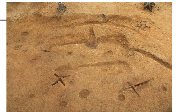
竪穴建物 SH106・121（南から）